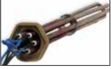
Isıtma grubu (Daldırma tipi 3'lü rezistans)

Her bir ısıtma grubuna 3, 6 veya 7 kW gücünde olan rezistanslar entegre edilmiştir ve her biri elektronik kart tarafından ayrı ayrı kumanda edilebilir.