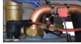
NTC sensör ve STB (limit termostat)

eloBLOCK cihazlarda bulunan limit termostat (STB) cihazı yüksek sıcaklıklara karşı korumaktadır.