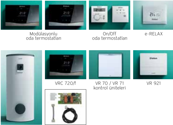
Modülasyonlu oda termostatları